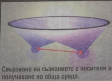
Свързване на съзнанието с носител и получаване на обща среда.