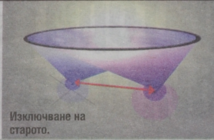
Изключване на старото.